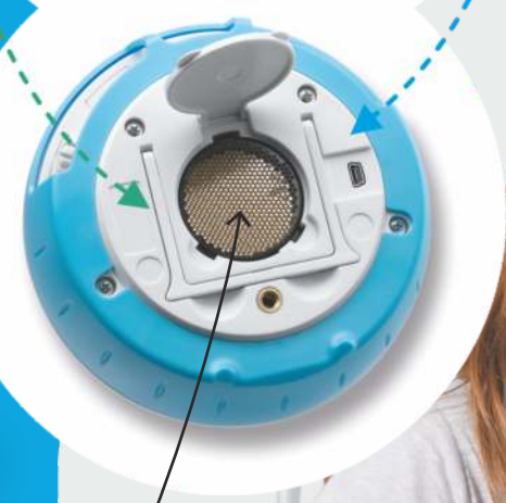
Czujnik odległości umieszczony z tyłu dysku