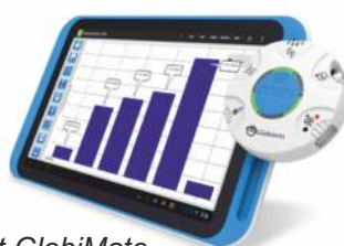
Tablet GlobiMate z dyskiem Mini